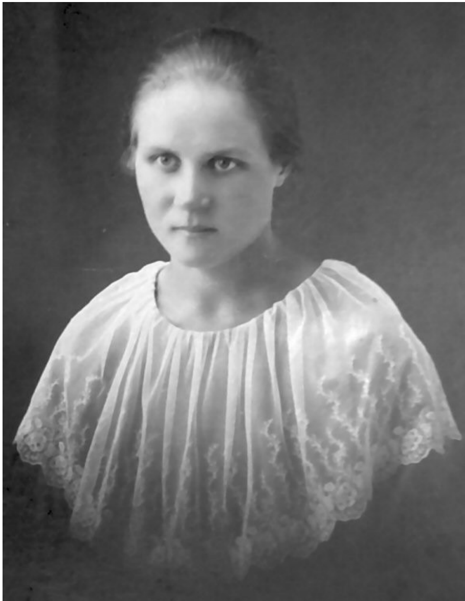
Tyynen rippikuva kuitenkin on ilman muuta valokuvia siitä parhaasta päästä.

Heikoimmat kuvat ovat kaikki kuvankäsittelyn keinot hyödyntäenkin haastavia esittää isoina ja tarkkoina. Aina ei henkilöiden tunnistaminen ole mahdollista montaa henkilöä esittävistä kuvista. Haluan kuitenkin käyttää niitäkin tässä hyväkseni.